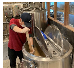
第1回目の醸造の様子