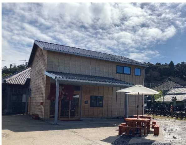
Brewery 伊能忠次郎商店 建物外観

本年3月よりレストランのみ先行して営業開始しておりましたが、この度チーズ製造・販売を開始し、 7月14日(木)からは自家醸造したビールの提供も開始しました。 レストランで使用する食材はもちろんのこと、ホップや生乳など、ビールやチーズの原材料も香取市産にこだわり、四季を通じて関東有数の生産高を誇る 香取市農畜産品の魅力を発信してまいります。 ぜひ、町歩きの途中にお気軽にお立ち寄りください。